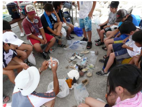
天草海辺の達人キャンプにて