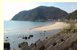
アフター (H27.3) ずいぶん砂が戻ってきました

このフリーペーパーは不定期になが〜く続けていきたいと思っておりますのでどうぞよろしくお願ひ致します。！！興味のある方いっしょに活動しませんか？