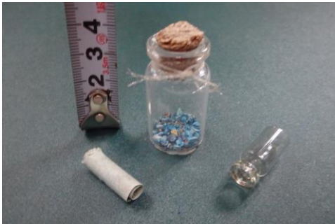
二重構造のメッセージボトル

遠い国から海流に乗ってやってきた、願いごとや想いのメッセージボトルが今も天草のどこかの海岸に打ち上げられているかも知れません。