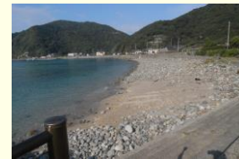
ビフォー 昨年の台風直後の砂浜。 (H26.夏)