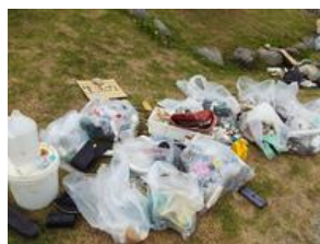
集まった生活ゴミ