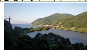
遠くには東シナ海 そして二ホンウナギの生息する池田池

東シナ海に面する魚貫崎の自然を活かし二ホンウナギの生息する池を周遊散策できるフットパスコースをつくり交流人口を増やすというのが目的ですが海岸を歩くビーチコーミングも取り入れたこの土地らしいものをつくりあげたいと思っています。8月は、天草の学童さん2団体と熊本市からの1団体さんがビーチコーミングキッズへ参加してくれました。夏休みなのに海へ入らず漂着物拾いをして遊びました。資源からゴミへの変身は私たちが決めてるんだってことを「妖怪ぶっちらかす」がおしえてくれました。11月は、漂着物学会の大会が沖縄・石垣島で行われました。会員の皆さんの研究発表やポスターでの発表展示、作品の展示などはブログのほうでご紹介しております。(田舎暮らし・結乃里便り) 同じく11月福岡マリンメッセに行われた「キャンピングカー&アウトドアショー」では、ビーチコーミングのお宝展示と貝殻クラフトをさせて頂きました。これは、九州自然学校協議会さんのブース(自然素材のクラフト作り)に入れていただいたものです。ドンダリの笛や丸太切りなど人気でした。福岡の子供たちに天草っていうところから来ましたよって宣伝してきました。今年度もあと3ヵ月、この冬がお宝と出会える期待大ですから頑張ってビーチへGO!!です。