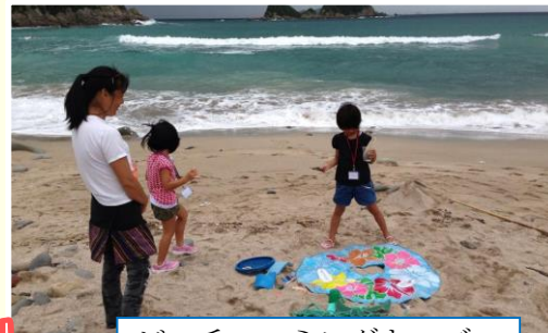
ビーチコーミングキッズ

11月 漂着物学会沖縄・石垣大会参加・「キャンピングカー&アウトドアショー」参加